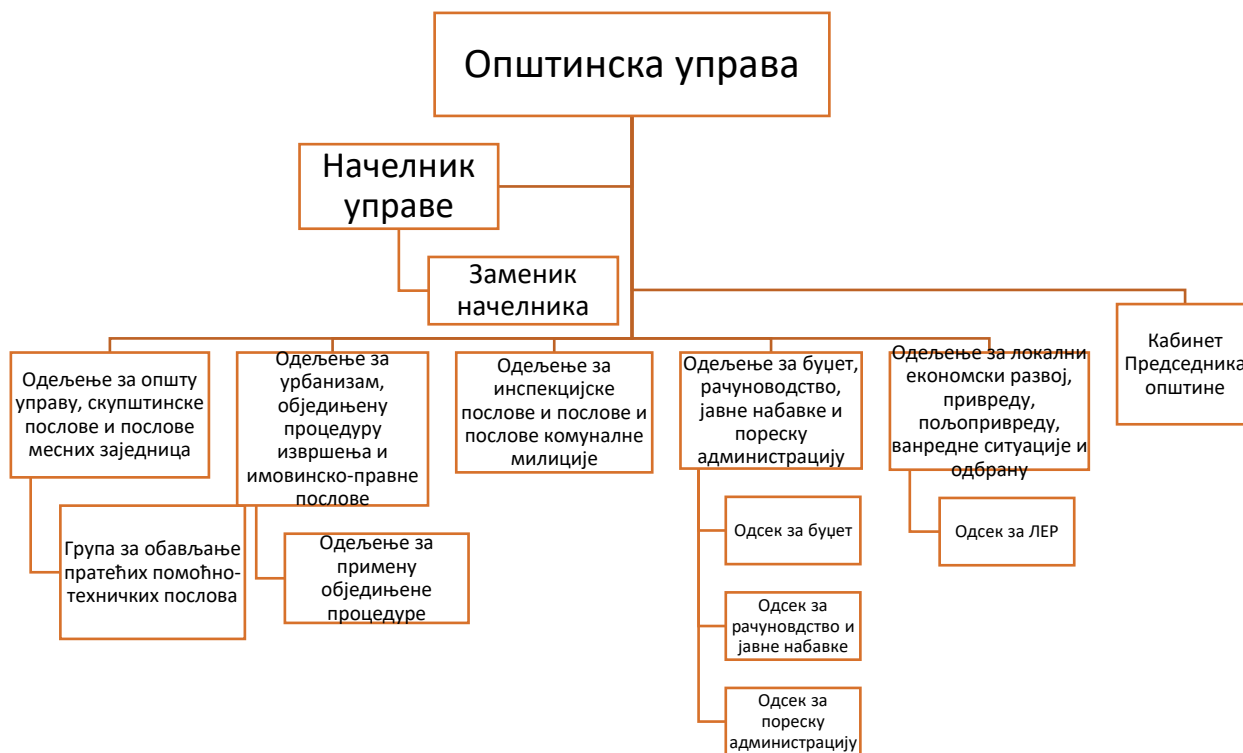
Дијаграм 2: Организациона структура Општинске управе општине Бољевац

У оквиру Општинске управе послују као посебне јединице и: Кабинет Председника општине, Правобранилаштво општине и Заједничка јединица за интерну ревизију општина Бољевац и Сокобања (Дијаграм 3).