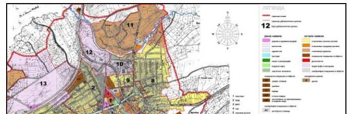
Слика 1. Положај предметне локације у Плану генералне регулације за насељено место Бољевац

План генералне регулације за насељено место Бољевац се радио као наставак Генералног плана Бољевца и као такав представља континуитет планирања Бољевца који треба да обезбеди даљи развитак града, уз поштовање традиционалних вредности и савремених принципа одрживог развоја који подразумевају усаглашен економски, социјални и просторни развој.